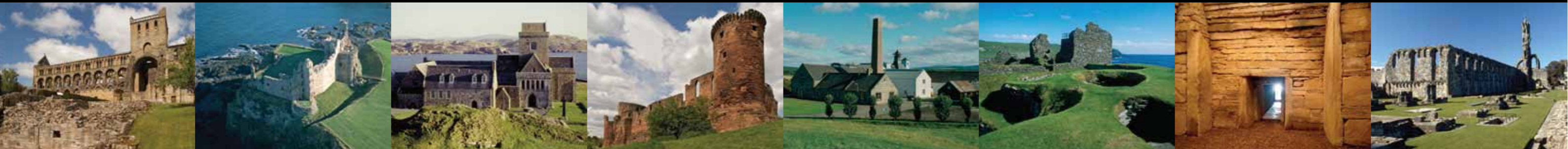
13. Jedburgh Abbey 9. Tantallon Castle 41. Iona Abbey and Nunnery 25. Bothwell Castle 59. Dallas Dhu Historic Distillery 78. Jarlshof Prehistoric and Norse Settlement 76. Maeshowe Chambered Cairn 47. St Andrews Cathedral

*Pre-booking is required at: Rowallan Castle and Cairnpapple Hill (0131 550 7603) Trinity House Maritime Museum (0131 554 3289) Maeshowe Chambered Cairn (01856 761606) St Vigeans Sculptured Stones (01241 878 756)